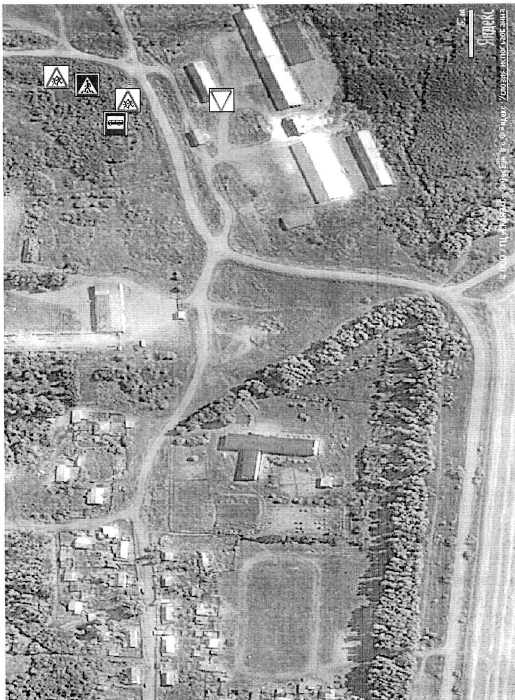
Схема безопасного расположения остановки автобуса Зелёнополянской средней общеобразовательной школы - филиала МБОУ «Троицкая средняя общеобразовательная школа №2» (осуществляющего подвоз обучающихся из с.Степное, а также при организации выездных мероприятий):