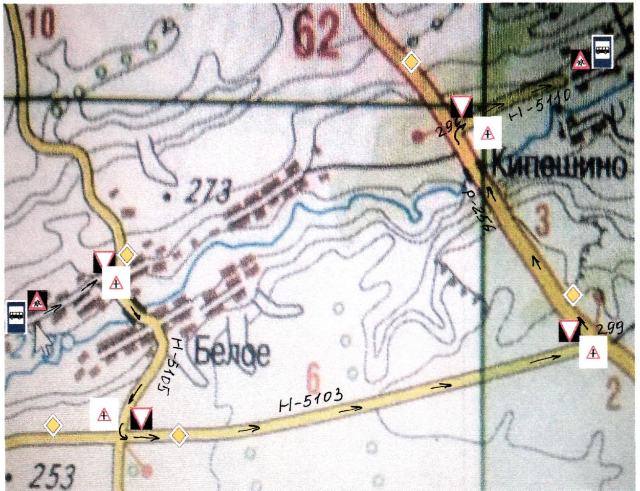
СХЕМА МАРШРУТА С УКАЗАНИЕМ ЛИНЕЙНЫХ, ДОРОЖНЫХ СООРУЖЕНИЙ И ОПАСНЫХ УЧАСТКОВ